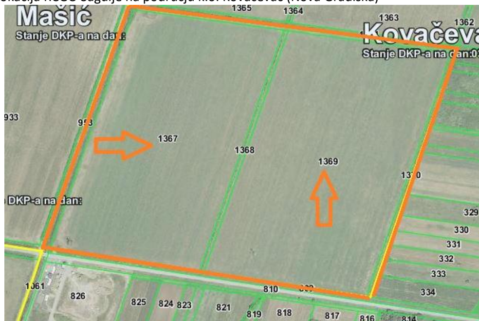
Slika 2: Lokacija RCGO Šagulje na području k.o. Kovačevac (Nova Gradiška)

Lokacija je definirana u Prostornom planu Grada Nove Gradiške, kao i u županijskom Prostornom planu za Županijski/Regionalni centar za gospodarenje otpadom, a u državnom planu gospodarenja otpadom je označena kao lokacija budućeg Regionalnog centra za gospodarenje otpadom.