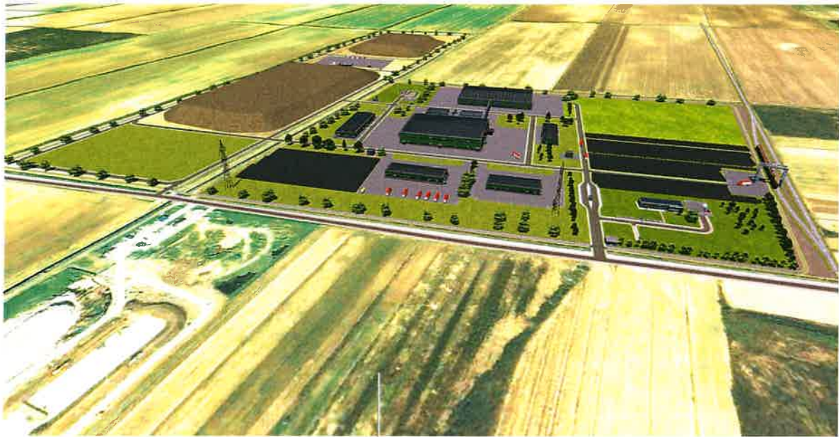
Slika 3: Vizija i misija Društva