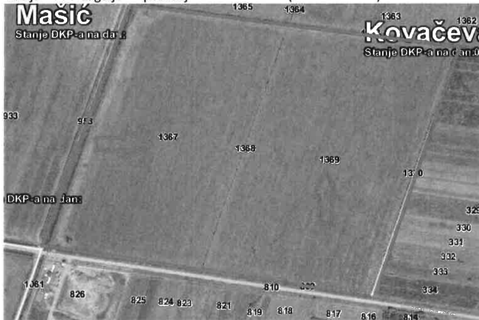
Slika 2: Lokacija RCGO Šagulje na području k.o. Kovačevac (Nova Gradiška)

Lokacija je definirana u Prostornom planu Grada Nove Gradiške, kao i u županijskom Prostornom planu za Županijski/Regionalni centar za gospodarenje otpadom, a u državnom planu gospodarenja otpadom je označena kao lokacija budućeg Regionalnog centra za gospodarenje otpadom.